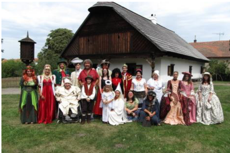
Skanzen v pohádkách Zdeňka Trošky

Stává se již tradicí, že o prázdninách zavítá do skanzenu režisér Zdeněk Troška. Akce spojená s jeho jménem a jeho osobní účastí – Skanzen v pohádkách Zdeňka Trošky – proběhla 9. 8. 2014, shodou okolností o nejteplejším víkendu celého léta... I přesto se akce zúčastnilo na 590 návštěvníků. Součástí akce byla opět výstava kostýmů, které byly použity v pohádkách natáčených v přerovském skanzenu. Návštěvníci, hlavně dětští, měli možnost na několika stanovištích si vyzkoušet svoji zručnost a důvtip, za což byli všichni účastníci odměněni. Nezbytným je i diktát ve staré škole v podání pana režiséra Zdeňka Trošky.