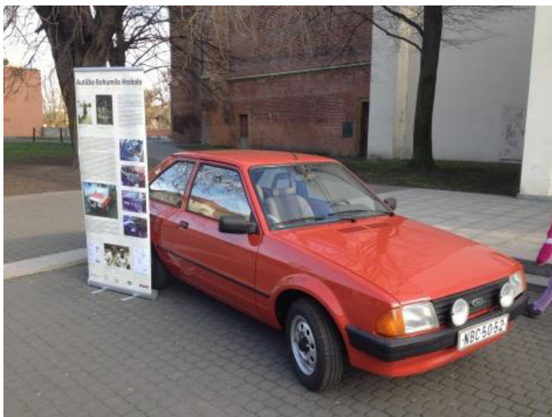
Osobní automobil Ford Escort Bohumila Hrabala po generální opravě