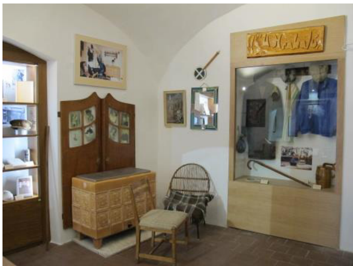
Expozice Bohumila Hrabala po rekonstrukci

V roce 2014 bylo návštěvníkům Polabského muzea k dispozici celkem na 13 stálých expozic, přičemž se třeba expozice v PNM Přerov nad Labem skládá z mnoha dílčích částí tvořící celek s názvem Život lidu na polabské vesnici od poloviny 18. do poloviny 20. století . Podobná situace je v muzeu v Poděbradech, kde stálá expozice Příběh Polabí je tvořena též z několika částí.