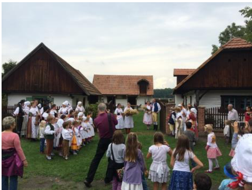
Dožínky ve skanzenu – před zahájením průvodu ze skanzenu do zámku

Své příznivce má i další akce, která se v areálu PNM uskutečnila 13. 9. 2014, a to Dožínková slavnost – v zámku a podzámčí . Akce se uskutečnila ve spolupráci s obcí Přerov nad Labem a Českým rozhlasem, který umožnil vstup do přerovského zámku, kde se odehrávala část doprovodného programu. Na dožínkách jsme přivítali více než 600 návštěvníků.