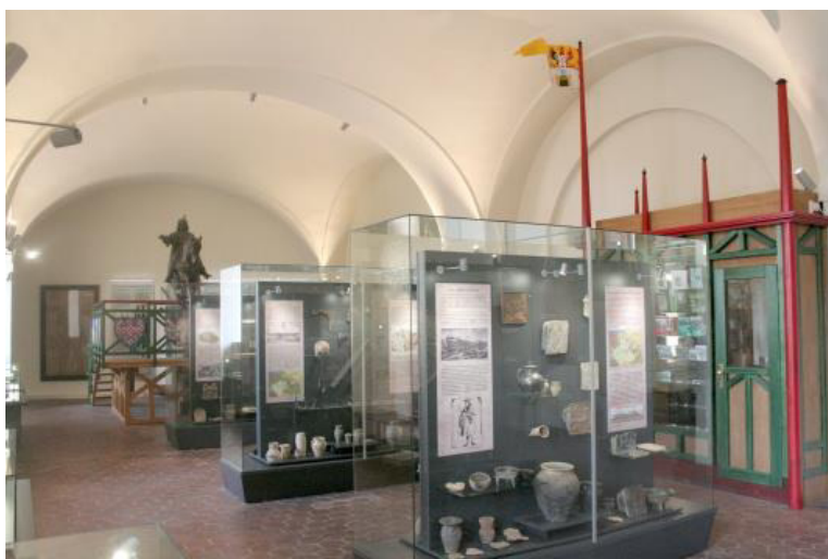
Památník krále Jiřího po rekonstrukci

Financování akce rekonstrukce Památníku kr. Jiřího bylo schváleno Zastupitelstvem Středočeského kraje na svém zasedání 9. 12. 2013, v celkové výši 3.000.000,- Kč. Samotná akce byla zahájena v polovině ledna 2014, kdy bylo, po jednáních s hejtmanem SK, stanoveno otevření Památníku na 23. 4. 2014. Okamžitě byly zahájeny práce na realizaci projektové dokumentace výstavního mobiliáře a architektonického pojetí expozice, vč. rekonstrukce elektroinstalace (vlastní práce na rekonstrukci elektroinstalace dle našich požadavků financovala Univerzita Karlova jako vlastník objektu). V součinnosti se Středočeským krajem bylo vyhlášeno výběrové řízení na dodavatele mobiliáře. K předání staveniště došlo 21. 3. 2014, kdy bylo zahájeno provádění veškerých stavebních prací. Po intenzivním pracovním nasazení všech zainteresovaných byla I. etapa rekonstrukce zakončena slavnostním otevřením 23. 4. 2014. Druhá etapa rekonstrukce byla ukončena k 9. 7. 2014, kdy proběhlo slavnostní otevření celého rekonstruovaného Památníku krále Jiřího. Expozice koncepčně a tematicky navazuje na stálou expozici Příběh Polabí v Polabském muzeu Poděbrady.