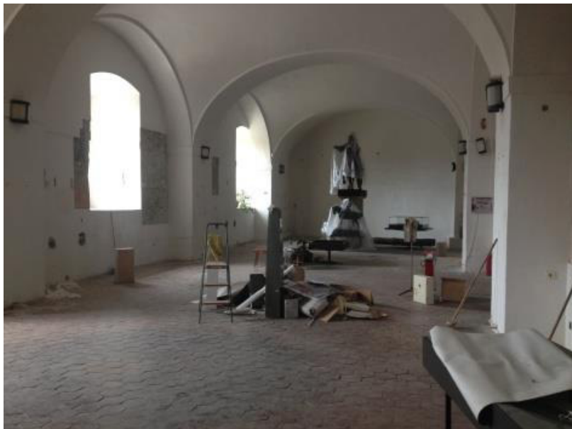
Památník krále Jiřího při rekonstrukci