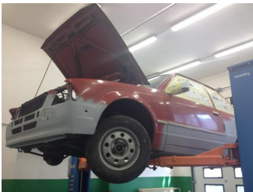
Osobní automobil Ford Escort Bohumila Hrabala při provádění generální opravy

Mezi asi nejzajímavější restaurátorským počinem byla bezesporu generální oprava osobního vozidla po spisovateli Bohumilu Hrabalovi. Opravený vůz byl představen při zahájení Oslav 100. výročí narození spisovatele Bohumila Hrabala 28. 3. 2014.